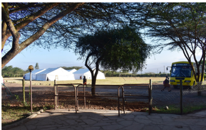
Klasseundervisning i de nyindkøbte store telte