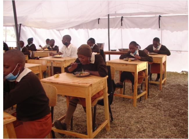
Undervisning og spisning af den gode mad på afstand i de nye telte

og kulturen gør kvinderne meget frygt- somme og tilbageholdende med at tale om det.