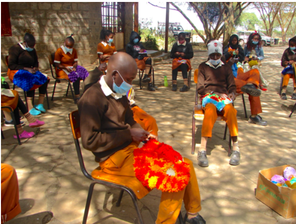
Håndarbejdet genoptages efter lang tids pause ude i skolegården

Men den 5. januar kørte så endelig de to store gule skolebusser ind på grunden allerede kl. 7 om morgenen med de første elever. De gamle gule skolebusser, der har 37 sæder, måtte køre en del ekstra gange op og ned af den hullede jordvej for at kunne overholde de strenge afstandskrav mellem børnene.