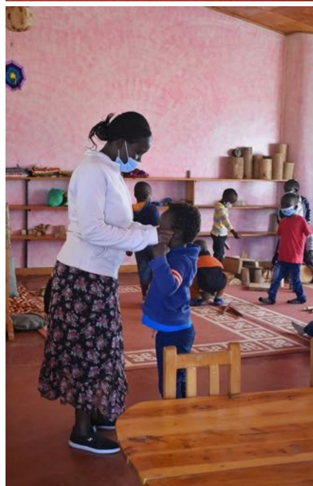
De små børn i børnehaven er også tilbage