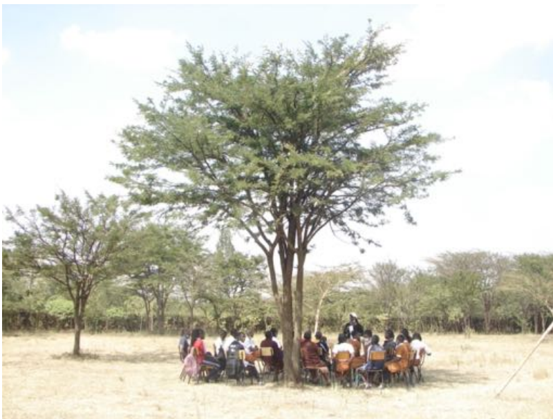
Undervisning af 9. kl. i det fri under akasietræet

Her et kort særnummer af vores Sanduko Nyhedsbrev for at formidle helt aktuelle ord og foto fra den 5. januar, da en af vores største samarbejdsskoler i Nairobi, i Kenya – Mbagathiskolen - åbnede hele skolen igen efter en lang covid 19- nedlukning siden midten af marts 2020. En længe, længe