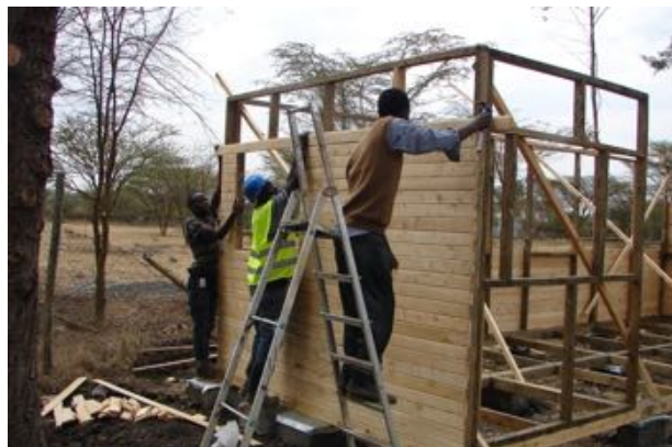
Fra de mange travle aktiviteter på Mbagathi Skolen under nedlukningen

Så, ja, det har været og er en tid fyldt af meget menneskelig angst og usikkerhed grundet Covid19; men skolen har samtidig under disse tunge vilkår formået at udvise stor fleksibilitet i at føre skolen konstruktivt og aktivt videre med store forbedringer for børnene som resultat.