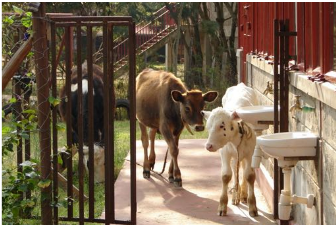
De nye håndvaske vækker beundring hos farmens kalve