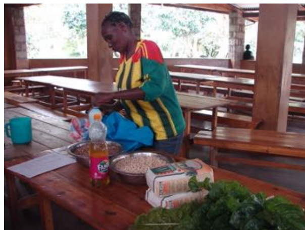
Madnødhjælpkasser fra Sanduko hentes på Mbagathi Skolen