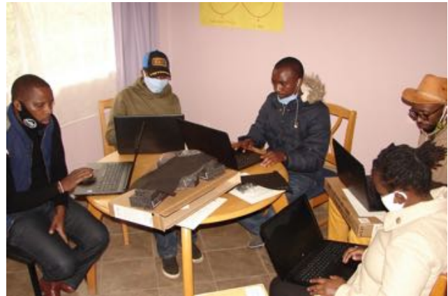
Lærere i gang med planlægning af digital undervisning