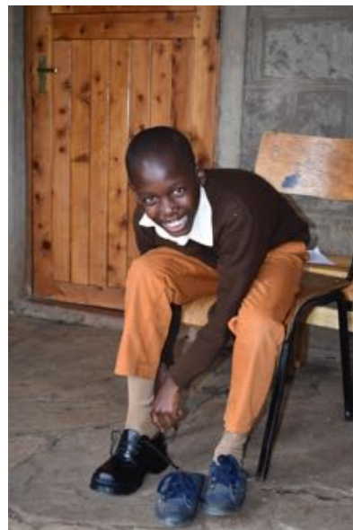
Nye skolesko og skoleuniformer bringer stor glæde. foto fra tidligere år.

Alle vil være vokset ud af deres gamle skolesko og skoleuniformer, som i forvejen meget ofte var arvede fra søskende og meget slidte. I kan sikkert forestille jer det: trøjer med lange tråde fra ærmerne, fordi de er ved at blive trevlet op af slitage, eller pigernes kjoleliv, der sidder alt for højt, bukserne, der er