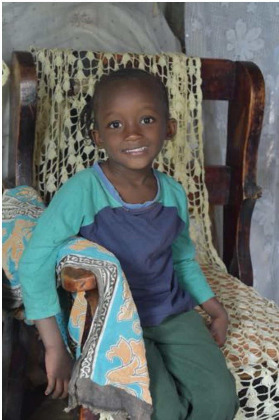
Et sponsorbarn derhjemme under Covid19 Nedlukningen