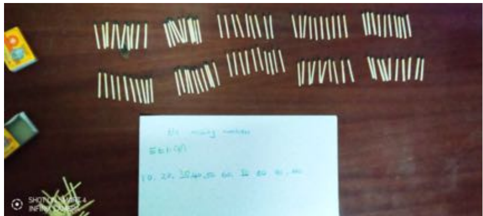
Geografi og regning udført med fantasi i slummen

Sanduko har været en del af en meget aktiv fundraising under nedlukningen, for at sikre skolens overlevelse i driftområdet, for at samle donationer til en højst nødvendig renovering af skolebygningerne og for at kunne arbejde med en forberedelse af genåbningen af skolen med alle dens restriktioner. Efter restriktionerne skal der være en-mands borde, - en meter plads imellem alle elever betyder undervisning udenfor i enkle telte. Der er arbejdet med forbedring af skolens vandinfrastruktur med opsætning af mange nye håndvaske m.m. Der er krav om et særskilt "Første Hjælps Rum" på skolen, og en schweizisk donation har givet midler til opførelse af rummet - et enkelt træhus imellem skolebygningerne. Dette arbejde har ikke kun involveret skolens normale stab