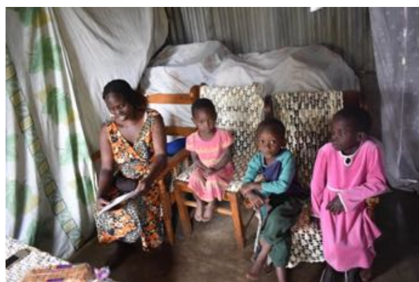
Glimt fra Børnenes hjem i slumområderne

Trods de mange tunge perspektiver i Mbagathi-Skolens livsomstændigheder er dens drift bevaret i aktivitet og hele dens overlevelse sikret. Her har de mange sponsorpenge kommende fra de store europæiske hjælpeorganisationer, der står tættest på skolen været af afgørende betydning. Her kan nævnes Sanduko og også dens større søsterorganisationer, Freunde der Erziehungskunst og Zukunftstiftung fra Tyskland, samt Accacia fra Schweiz, som hjælpeorganisationer, der er tættest på. Det er disse skolepenge/sponsorater, der har holdt skolen og alle de bærende aktiviteter sammen, opretholdt de ansattes stillinger og gjort det muligt for lærerne hver eneste dag at arbejde med kontakten til og undervisningen af børnene gennem digital undervisning. Hvad der har været af afgørende betydning. Nogle af børnene har været meget svære