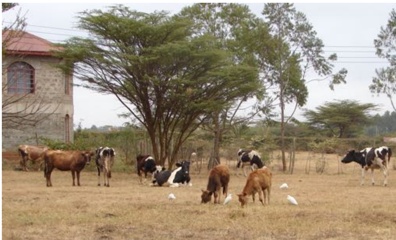
En skole uden børn under Covid19 Nedlukningen - Mbagathiskolen ”

Som beskrevet i Nyhedsbrevet i juni er det en meget speciel situation, som Steinerskolerne i Afrika står i. Vores samarbejdskontakter er i Sydafrika og Zimbabwe, men først og fremmest i de tre Østafrika lande – Tanzania, Uganda og Kenya, med et særligt fokus på Kenya.